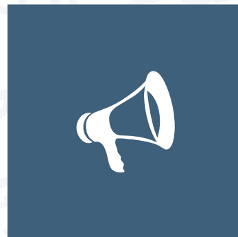
PR & MEDIA