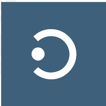
OUTREACH & INTERGRATION

Ob es um akademische Angelegenheiten, oder Freizeitgestaltung geht, ist ISUS immer aktiv tätig. Es werden u.a. Bücherbörsen, kulturelle und Sportevents organisiert, sie sind aber auch bei sozialen Projekten der Stadt mit vollem Einsatz dabei!