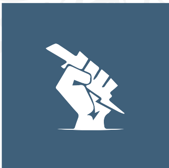
STRIKE FORCE TEAM